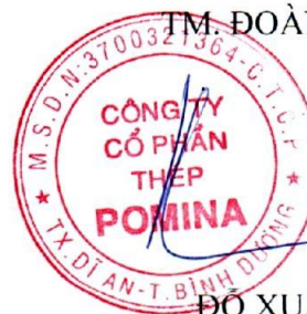
ĐỖ XUÂN CHIÊU